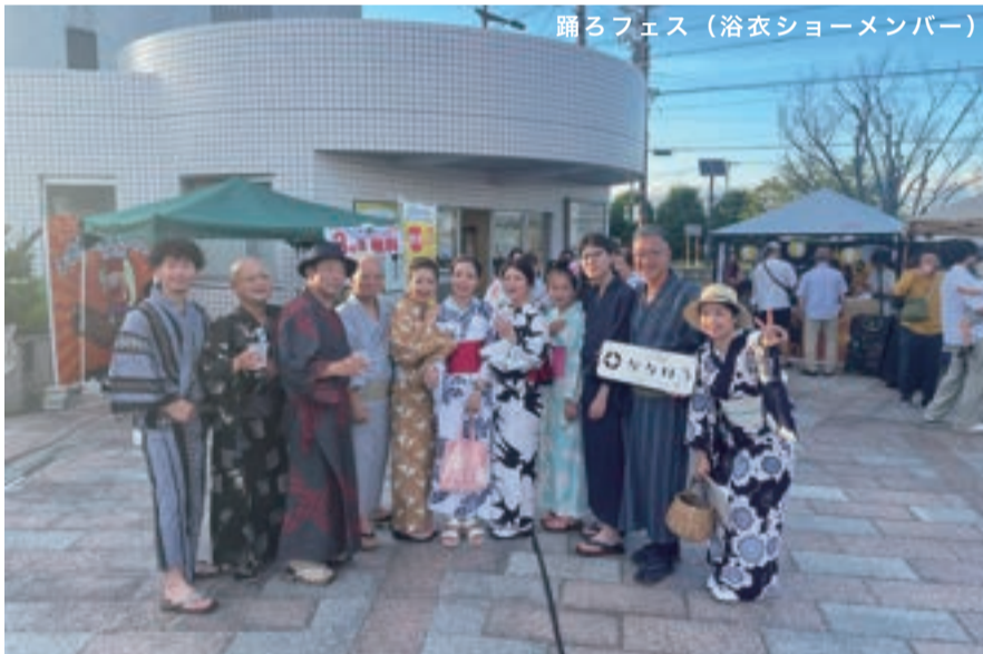
踊るフェス（浴衣ショーメンバー）

浴衣をここ2週間で2回着る機会がありました。浴衣を着ると夏がきたな～祭りの季節だ～なんて気持ちになります◎今回浴衣をきたのも、湖西市新居町の最初のお祭り『すみよっさま』と鷺津駅前ひまわり広場で開催された『踊るフェス』に参加したためです。『すみよっさま』では、昔からこの祭りを境に、新居の人々は、その年初めて浴衣を着始めるという文化があるそうです。『踊るフェス』は、今年初めて開催されたイベントでしたが、出店も立ち並び、フードファイトや浴衣ショー、盆踊りと町の賑わいを感じる素敵なイベントでした。湖西市の夏はイベントが目白押し！夏を感じ、最高の思い出を作りましょう！