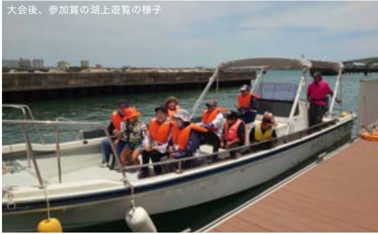
大会後、参加賞の湖上遊覧の様子