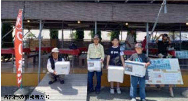
各部門の優勝者たち