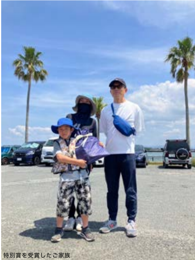
特別賞を受賞したご家族