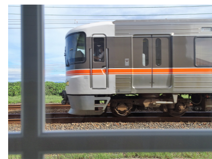
入選「ホテル窓からのト레인ビュー」