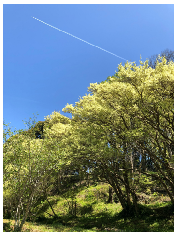
入選「トキワマンサク と春の空」