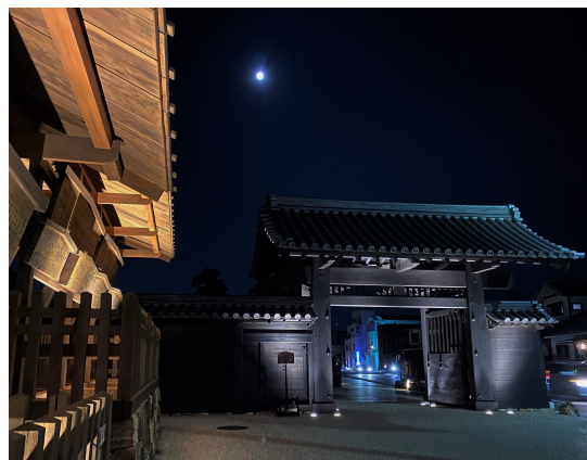
特選「関所の十三夜」