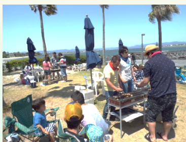
自分たちで好きな食材を持ち込み 開放空間で楽しくBBQ

コロナの外出自粛や梅雨の期間で外に遊びに行けなかった分、この夏は外で楽しい思い出を残してみてもどうでしょう？