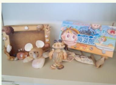
小さなお子様でも体験OK 貝殻や流木を使ったクラフト体験